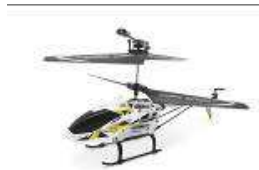
63613 H22 S5H

5. L'oggetto della dichiarazione di cui sopra è conforme alla pertinente normativa di armonizzazione dell'Unione: